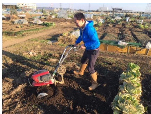
5年目になった市民農園での野菜作り