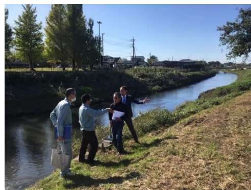
県職員との現地調査(元荒川)