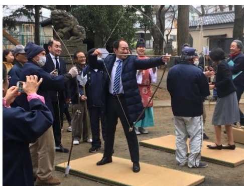
滝馬室氷川神社 的祭