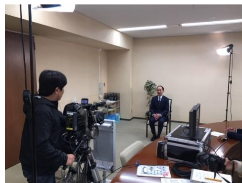
テレビ埼玉の収録