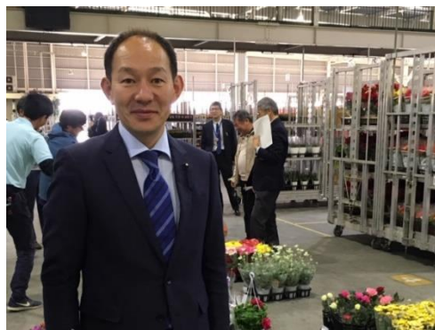
花の品評会(フラワーセンター)