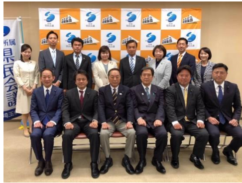
無所属県民会議14名の会派