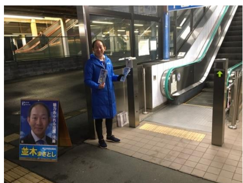
定期的な朝の駅頭活動

一日、一日そして一年が本当に早く過ぎていくように感じます。今年は、議員の職をいただいてから10年目、また50歳の節目を迎える年でもあります。朝の駅頭では、当時、私の胸にも届かないくらいの小学生男児の身長が今では大きく超えるようになりました。きっと身長伸びとともに大きな経験も積んでいる事でしょう