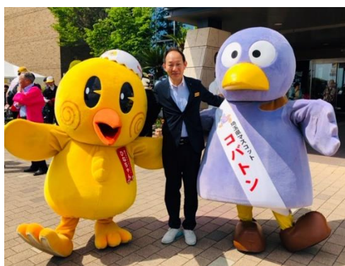
ポピー祭り(コスモスアリーナ)