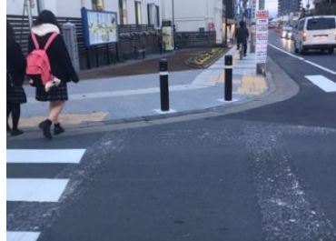
鴻巣駅入口交差点