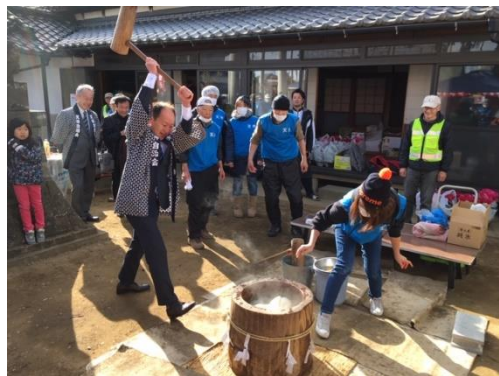
新年お楽しみ会(天神自治会)