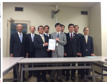
県庁での要望活動