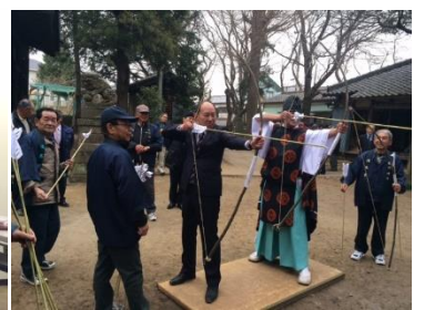
馬室氷川神社の的射祭

鴻巣市には障がい者手帳をお持ちの方が4,742人(H27.3.31日現在)です。障がい者手帳の申請は鴻巣市、発行は埼玉県となっています。