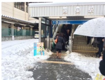
今回は鴻巣駅東口を雪かき