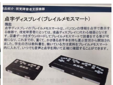
音声と点字で確認できます