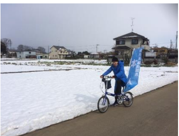
雪の中でも日頃の活動