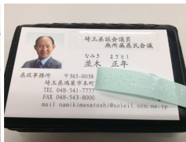
点字ラベルを名刺に活用