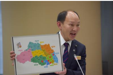
予算特別委員会で5回登壇