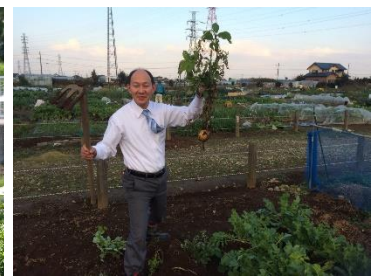
市民農園で野菜づくり