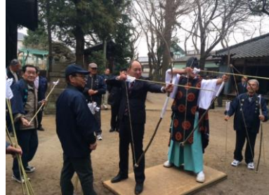
馬室氷川神社での的射祭