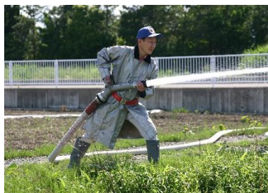
消防団活動20年目になりました