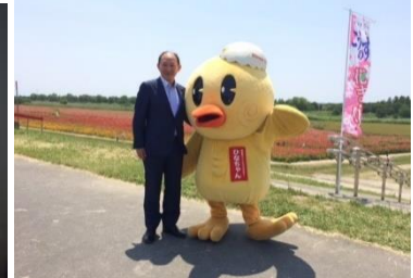
吹上地域のポピーまつり