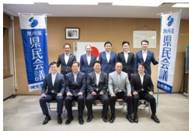
無所属県民会議の仲間たち