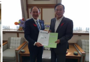
知事に地元要望を提出