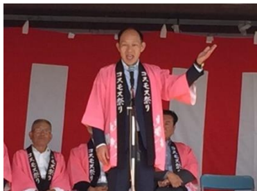
コスモスフェスティバル

対象者 ①親世帯・子世帯の両方または一方が市外から鴻巣市へ転入②親世帯・子世帯の両方または一方の住民登録が市外に1年以上ある③義務教育終了前の子供(出産予定含む)を扶養している。④三世帯同居または近居(市内)のため住宅を取得または増築。すべてに当てはまる方。 補助額 ①新築または購入30万円(2地区50万円)②増築10万