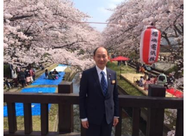
埼玉自然100選吹上さくら祭り