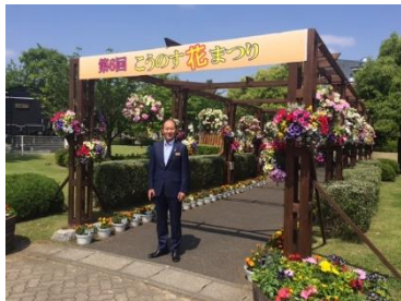
第6回こうのす花まつり