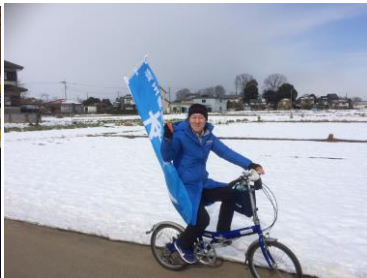
自転車で議会報告を配布