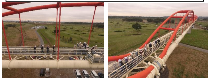
ドローンで撮影した昨年の様子