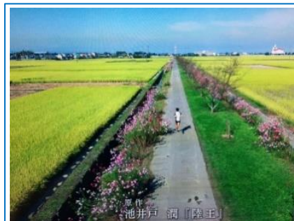
TBS FREE by TBS オンデマンド