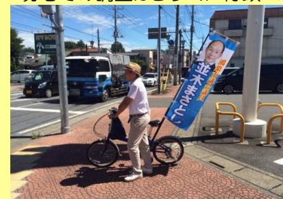
毎回、自ら議会報告を配布