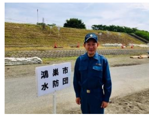
荒川北縁水防訓練 (熊谷市)