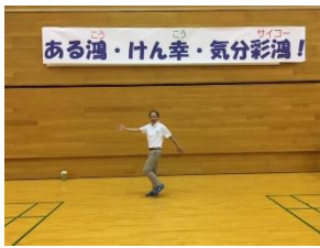
正しい歩き方セミナー (吹上コスモスアリーナ)