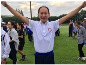
市民ラジオ体操会 (陸上競技場)