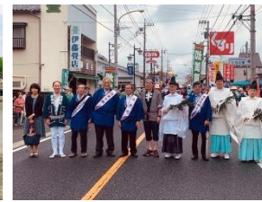
鴻巣夏まつり (中山道)