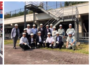
荒川水循環センター (戸田市)

私が所属する県議会の会派「無所属 県民会議」は改選前の7名から14名に仲間が増えました。