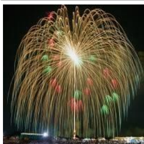
昨年このす花火大会で打ち上げられた四尺玉

県内では多くの花火大会が開催されていますが、今回、鴻巣市商工会青年部主催の花火大会が選ばれたことは歴代部長としてとても嬉しく感じます。今後、しっかり交流が図れるよう事業の効果も確認したいと思います。