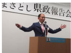
第3回県政報告会を開催しました。